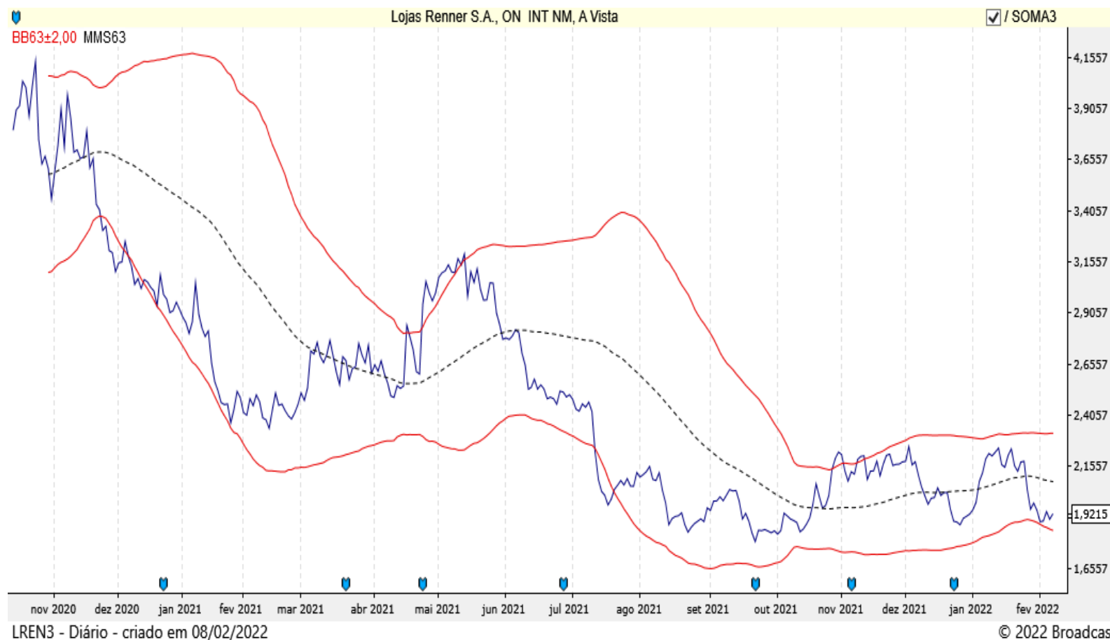
Gráfico *Ratio: LJS RENNER ON (LREN3) / SOMA ON (SOMA3)

* Ratio: é a divisão do valor da ação comprada pelo da ação vendida.